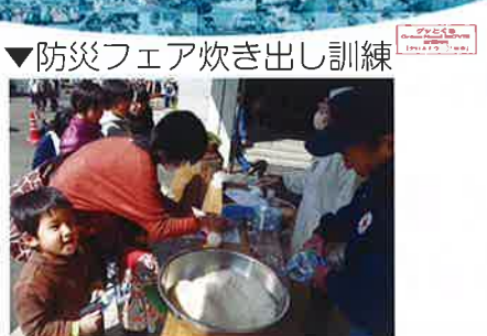
▼防災フェア吹き出し訓練