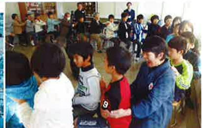
▲青少年赤十字活動