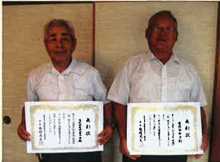
▲会員増強クラブ表彰 豊岡前陽気老年会・豊岡福寿会