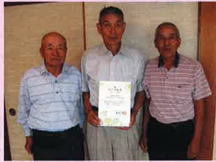
▲2015活動賞 仲間づくり活動部門 延野々若葉会